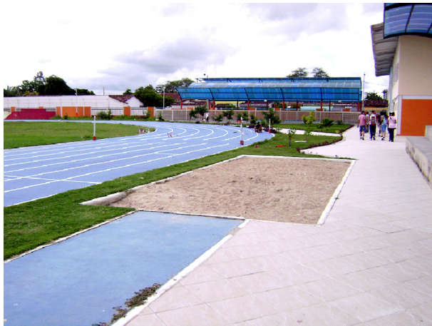
Imagem 02: Pista de atletismo, caixa de areia e piscina coberta ao fundo